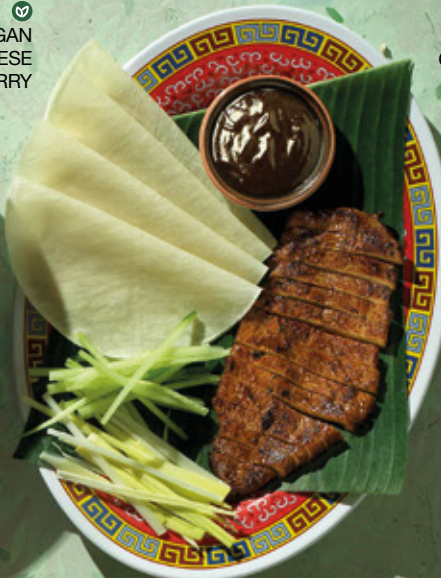
CORRAL CHICKEN PEKÍN