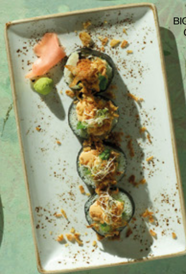
BIG CRACK CRUNCH ROLL