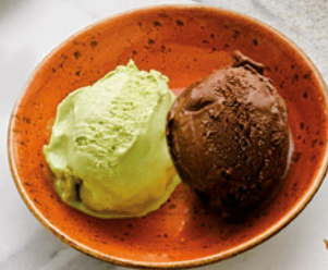
BINOMIO DE HELADOS