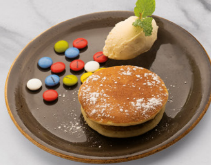
DORAYAKI DE CHOCOLATE