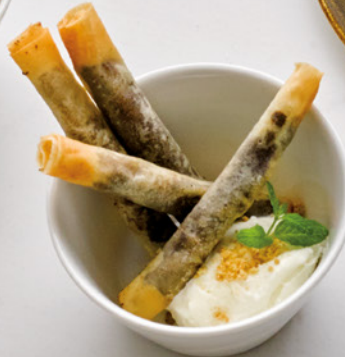
BANANA & CHO-CO

NEW Apple Tiramisú 4.95 Bizcochos ligeramente bañados en sake, compota de manzana y crema de tiramisú con té verde matcha