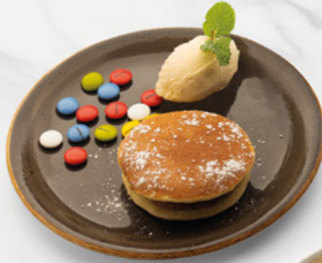
DORAYAKI DE CHOCOLATE