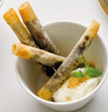
BANANA & CHO-CO

NEW Dorayaki de Chocolate 4.95 Postre tradicional japonés relleno de crema de chocolate y avellanas con helado de vainilla