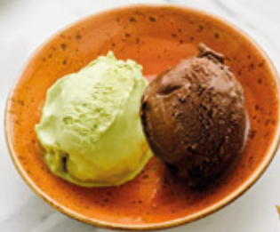
BINOMIO DE HELADOS